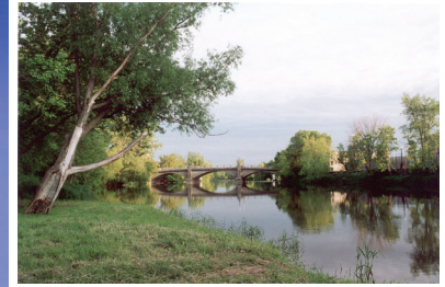
Université du Québec en Outaouais - Campus Saint-Jérôme