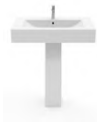
LAVABO/ÉVIER (21,7 %)