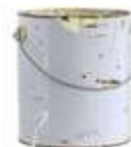
PEINTURE (33,3 %)