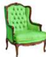
MOBILIER (43,5 %)